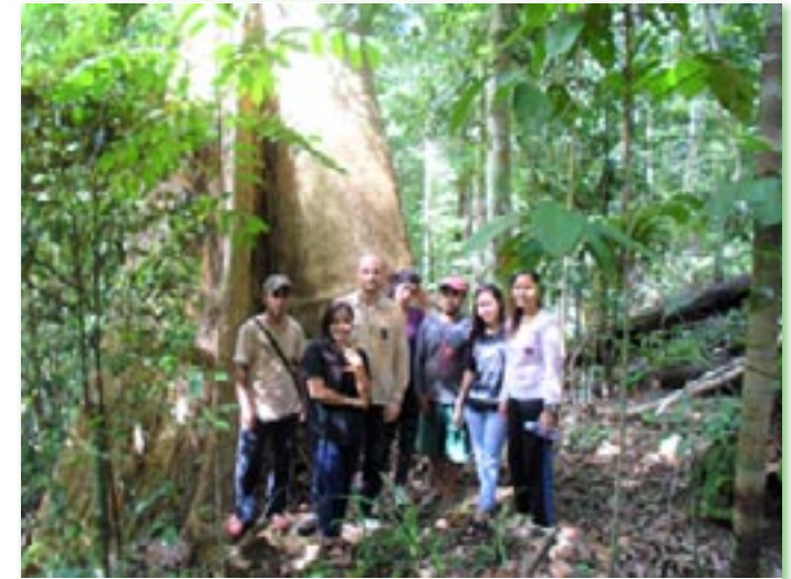
Een uitstapje naar het oude regenwoud met haar immens grote bomen

We moeten weer lokaal gaan kopen. Palmolievrij. Durven te vragen waar onze producten vandaan komen en transparantie eisen. We moeten verantwoordelijk gedrag gaan tonen, jong en oud, en onszelf de vraag stellen of we al die producten wel echt nodig hebben. Zo niet? Dan blijft er weinig over van dit mooie land. Van onze bruine, zachtharige vrienden. Van het groen en de gordel van smaragd.