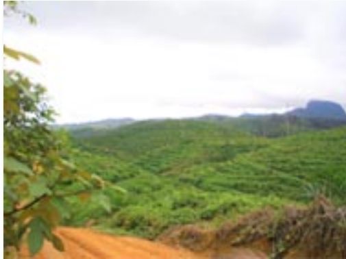
Palmolieplantages in een gekapt regenwoud in Kalimantan

Na een vlucht van een klein uur over uitgestrekt Borneo, dat bedekt is met kleine, vederlichte schapenwolkjes, zie ik het landingsgestel onder ons witte ATR 72 propellervliegtuigje uitklappen en groene velden met kleine hutjes dichterbij komen. De enorme palmolieplantages zijn vanuit de lucht goed te zien, alsook de enorme witbruine slierten die op grote modderpoelen lijken en hele stukken aarde doorsnijden.