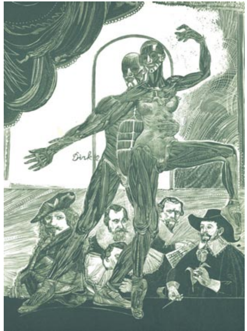
Origineel: 171 x 234 mm